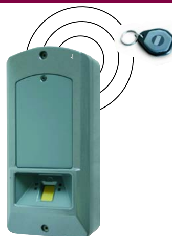
BIOMAT BIOMAT MIFARE